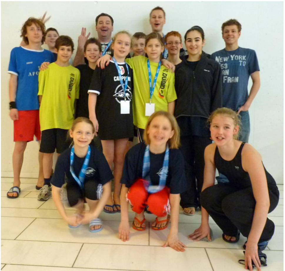
Ein Teil unsere Mannschaft beim diesjährigen „International Swim- Meeting“.

Mitglied des Berliner Schwimm-Verbandes e. V.